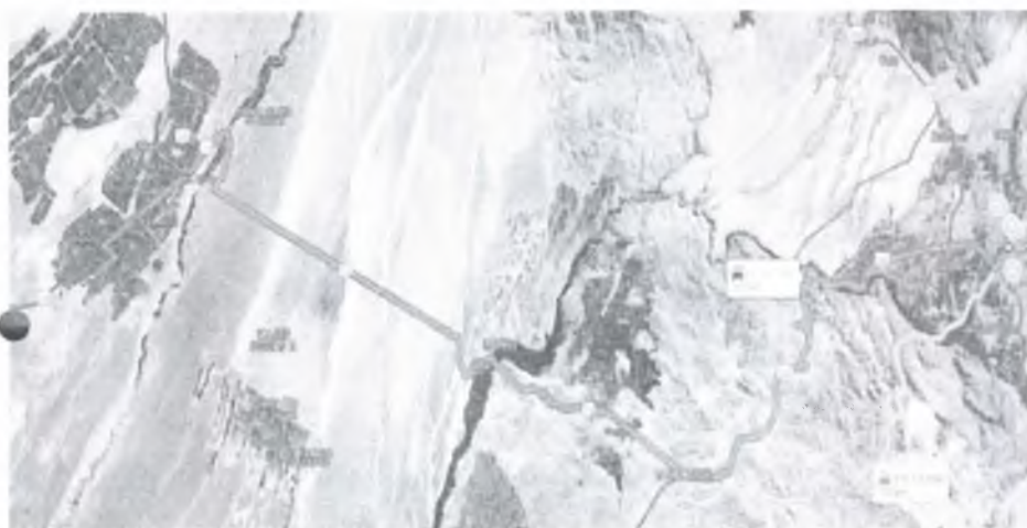
IMAGEN 1: SE MUESTRA EL ITINERARIO HASTA EL C.P. D4 JUAN VELASCO ALVARADO

De la evaluación del presente expediente administrativo se evidencia que la ruta solicitada por la administrada versa de la siguiente manera: Arequipa – Quilca (Vía Pedregal – D4 Juan Velasco Alvarado) con el siguiente itinerario: Arequipa – Peaje Uchumayo – Km. 48 – Vitor – El Pedregal – D4 Juan Velasco Alvarado –Quilca , conforme las siguientes imágenes 1 y 2: