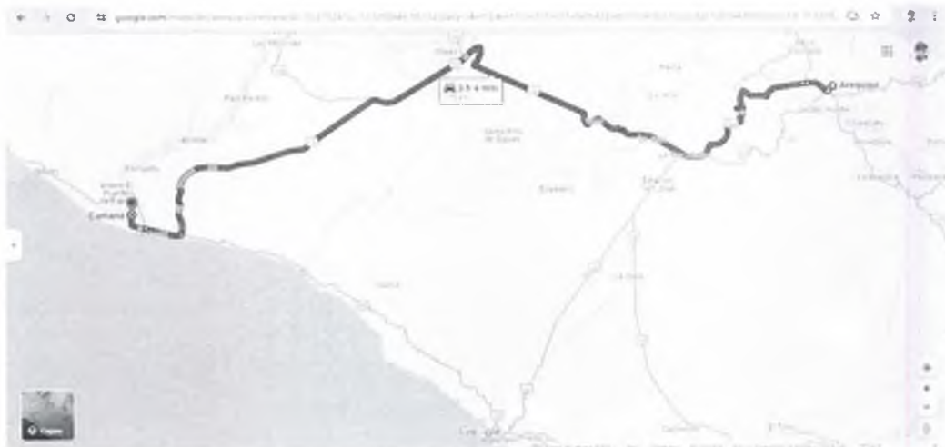
Imagen 3: Ruta de Arequipa a Camana

Revisado los archivos y la base de datos de la Sub Gerencia de Transporte Terrestre, se ha demostrado la existencia de empresas autorizadas que brindan el servicio con unidades vehiculares de la Categoría M3 Clase III de peso neto vehicular mínimo de 8.5 toneladas (permitidas por el RNAT), tal es el caso de la EMPRESA CAPLINA DE TRANSPORTES TURISTICOS INTERNACIONALES S.R.L. la cual obtiene también la habilitación vehicular en forma automática de una flota vehicular de 151 vehículos en la ruta de Arequipa – Camana y viceversa con el siguiente itinerario: Arequipa - Uchumayo - La Repartición - Vitor - Sigvas - El Pedregal – Cruce Majes – Camana , ruta autorizada mediante Resolución Sub Gerencial N° 001-2015-GRA/GRTC-SGTT (12/ENE/2015) y renovada mediante Resolución Sub Gerencial N° 013-2025-GRA/GRTC-SGTT (15/ENE/2015) y la EMPRESA DE TRANSPORTES FLORES HNOS S.R.L. , que mediante Resolución Sub Gerencial N° 0514-2018-GRA/GRTC-SGTT (27/DIC/2018) obtiene la renovación de la autorización para la ruta Arequipa – Camana y viceversa con el siguiente itinerario: Arequipa – Uchumayo – Vitor - Camana , cabe mencionar que mediante Oficio N° 486-2023-GRA/GRTC-SGTT (04/JUL/2023) se "OTORGA HABILITACION VEHICULAR EN FORMA AUTOMATICA de su flota vehicular autorizada y habilitada para el servicio de transporte de pasajeros nacional regular, (...)" (Sic) con un total de 285 vehículos conforme a la siguiente imagen 3: