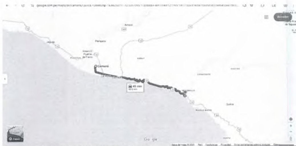
Imagen 4: ruta de Camana a Quilca

En ese contexto, el distrito de Quilca forma parte de la Provincia de Camana, siendo la autoridad provincial la facultada para autorizar el servicio de transporte de la ciudad capital " Camana " a cualquier otro distrito y/o centro poblado, más aún si en la ruta existe una superposición del 83.67 % equivalente a 104 km. y; que desde " Camana " hasta el punto de destino " Quilca " hay una distancia de 40 km el que debe ser autorizado por la autoridad local. (conforme a la imagen 4).